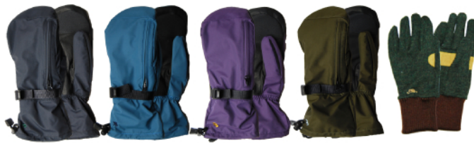
BLACK BLUE PURPLE OLIVE INNER GLOVE

グローブ内で「パー」ができるほど幅広いミットグローブ。カフ部分のみ裏地なしのワンプライで、ジャケットとの相性が向上しました。止水ファスナー付きの開閉可能なアウターで細かい作業もらくちん。フィット感抜群の圧縮ウールと豚革を組み合わせたインナーグローブはお出かけにも使える最高品質です。