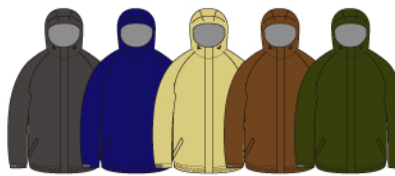
Charcoal Navy Ucon Amber Olive