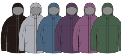
Black Gray Blue Dull Purple Cassis Moss