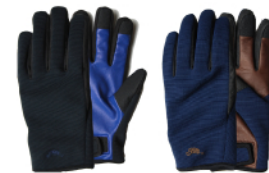
BLACK X BLUE NAVY X BROWN

ありそうでなかなか無いシンプルなぴったりフィットグローブ。もちろん防水フィルム内蔵です