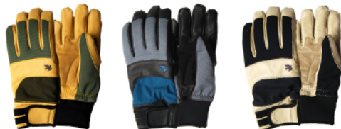
OLIVE X TAN GRAY X BLUE X BLACK BLACK X IVORY

アメリカのワークグローブをイメージしつつも異素材の組み合わせで立体感&高級感を持たせました。