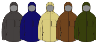
Charcoal Navy Ukon Amber Olive