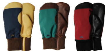
NAVY GREEN RED