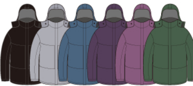
Black Gray Blue Dull Purple Cassis Moss